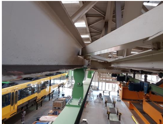
Untersuchungen am Bestandstragwerk für die Sanierung und Erneuerung der Kranbahnen im Betriebshof Möhringen