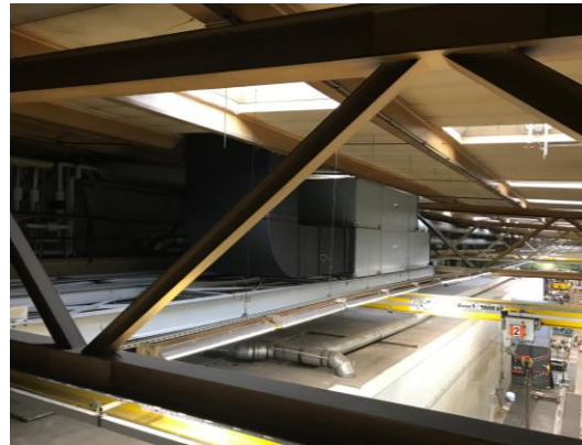
Erneuerung und Erweiterung der Lüftungsanlage in der Dachkonstruktion im laufenden Betrieb der Hautwerkstatt