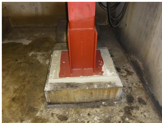
Sanierung und Umbau von diversen Fahrzeughebeständen in den verschiedenen Betriebshöfen

Die Stuttgarter Straßenbahnen AG muss für die Wartung und den dauerhaften Betrieb der öffentlichen Nahverkehrsmittel der SSB eine Vielzahl von Betriebs- und Sozialgebäuden vorhalten. Durch fortwährende Verbesserungen des Fahrgastkomforts, sowie der technischen Anforderungen an die Fahrzeuge, der größeren Fahrzeugabmessungen und der daraus resultierenden angepassten Betriebsabläufe bzw. durch gesetzliche Änderungen aus dem Brand- und Arbeitsschutz muss dieser Gebäudebestand fortlaufend angepasst, instandgehalten bzw. zum Teil auch erneuert werden. Hierbei sind wir nun seit vielen Jahren ein verlässlicher Partner der SSB.