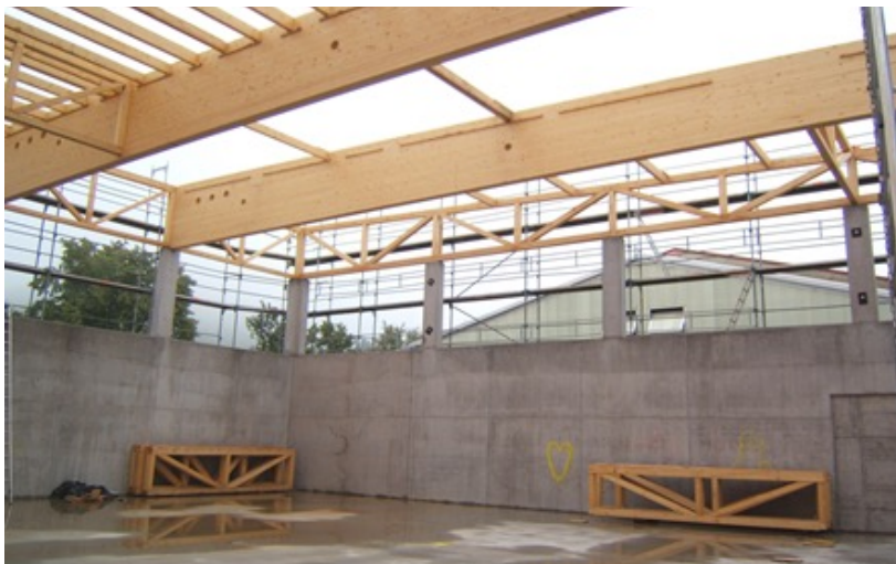
Rohbau bei Holzdachmontage