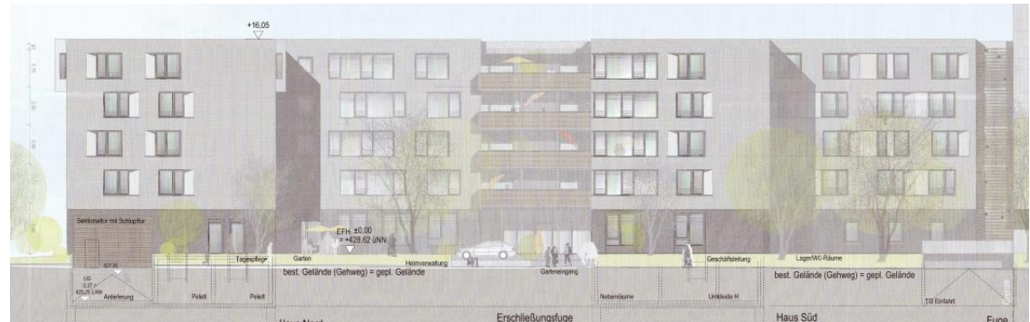
Ansicht West - Bethanien