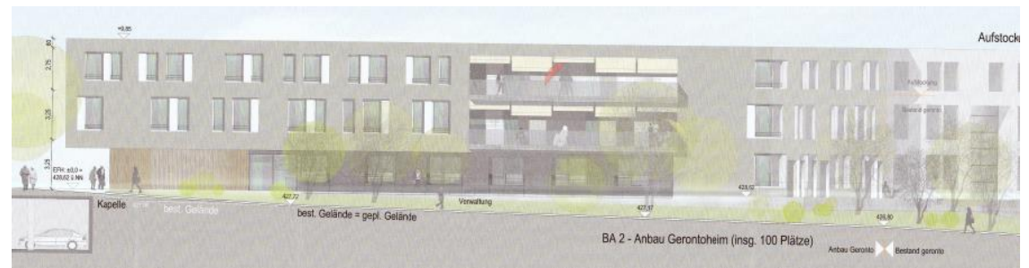
Ansicht Süd - Geronto