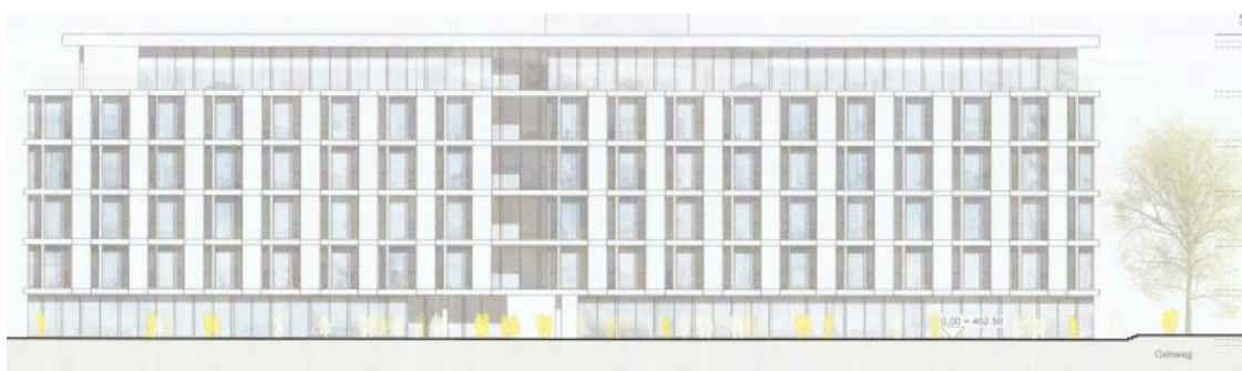
Ansicht West - Bürogebäude